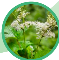
Wiązówka Błotna ( Olmaria ) przeciwzapalnie, przeciwbólowo przeciwgorączkowo