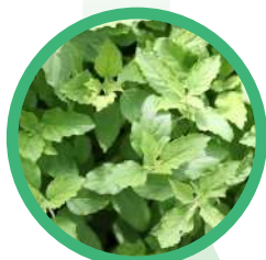
Bazyliia Święta zapobieganie stresom