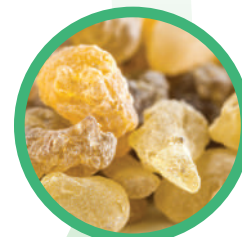
Boswellia Serrata ( Incenso indiano ) przeciwzapalnie