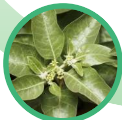
Witania Ospała ( Ginseng indiana ) przeciwzapalnie przeciwdrobnoustrojowo